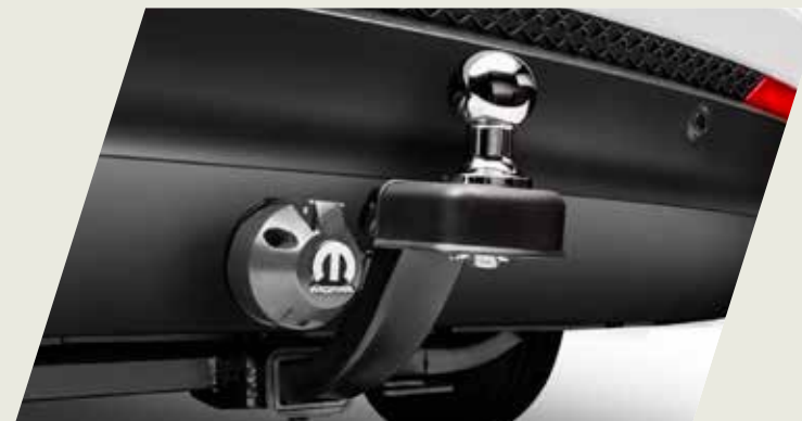
GANCHO DE REMOLQUE