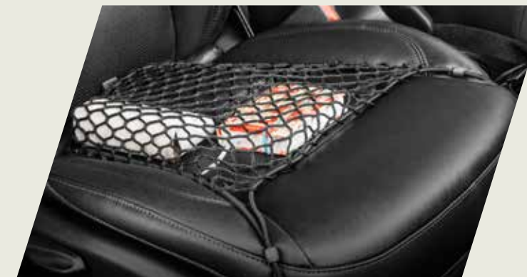
RED ELÁSTICA DE ASIENTO DELANTERO