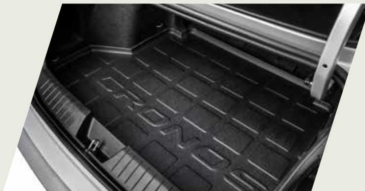
ALFOMBRA BAUL ANTIDERRAME