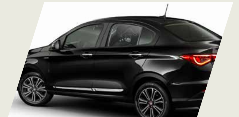
MOLDURA DE PUERTA CROMADA