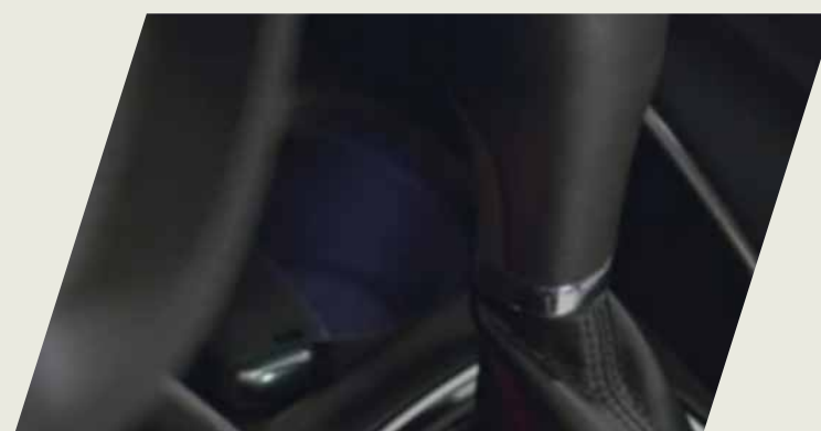
KIT ILUMINACION INTERIOR