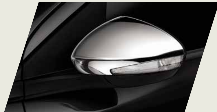
TAPA ESPEJO RETROVISOR EXTERNO CROMADO

Acercate a un concesionario y conocé la gama de accesorios originales que mopar te ofrece para equipar tu fiat Cronos, seguido de las imágenes de cada accesorio.