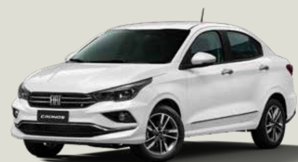
249 - Blanco Banchisa