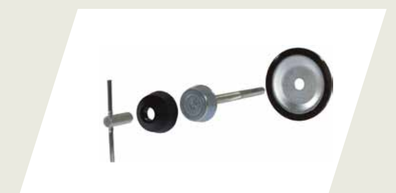
BULÓN DE SEGURIDAD PARA RUEDA DE AUXILIO