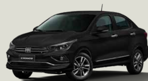
806 - Negro Vulcano