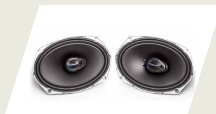
KIT PARLANTES TRASEROS