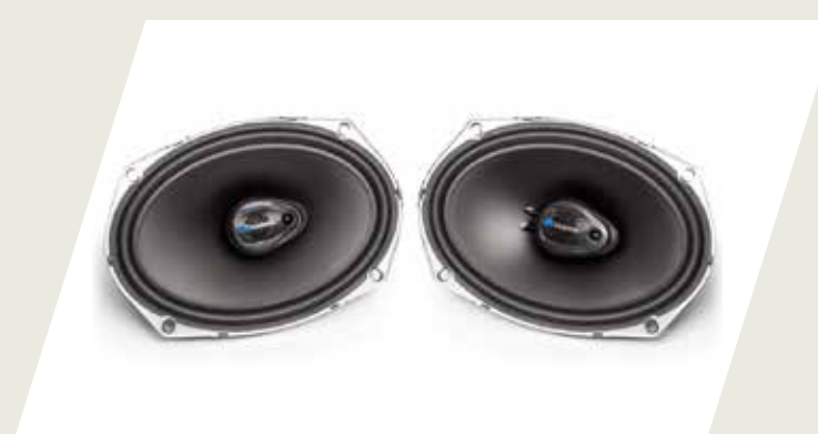
KIT PARLANTES DELANTEROS