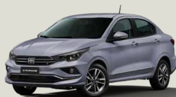
540 - Gris Strato