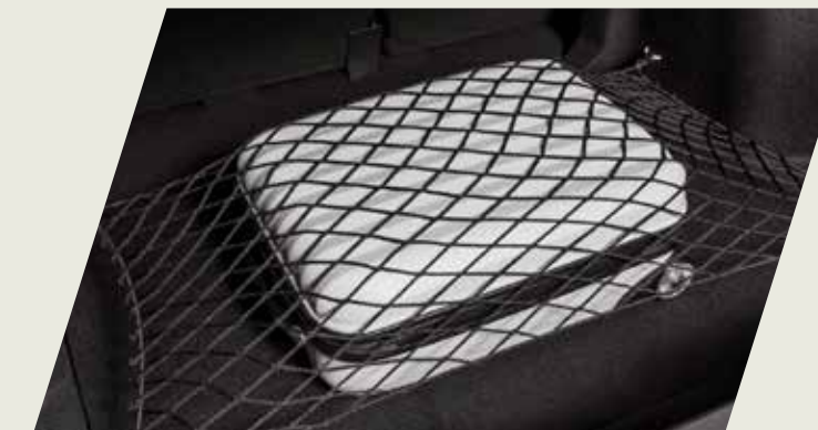
RED ELÁSTICA PARA BAUL