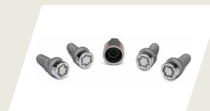
JUEGO DE TORNILLOS ANTIROBOS PARA RUEDA