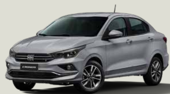
619 - Plata Bari