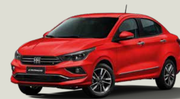
978 - Rojo Montecarlo