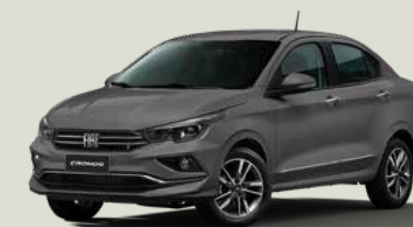
979 - Gris Silverstone